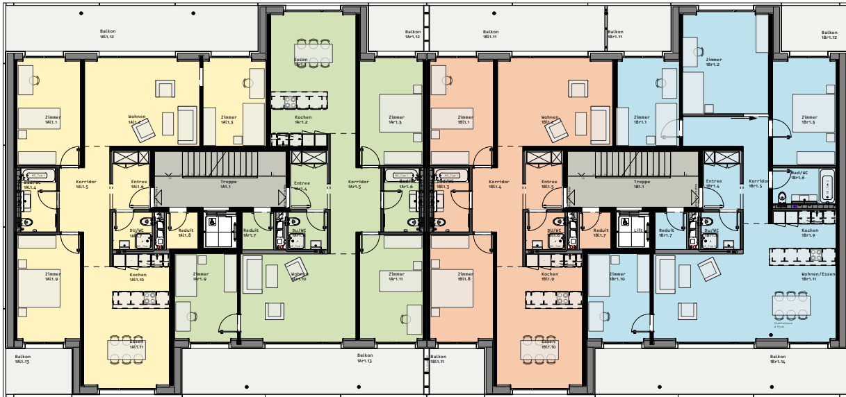
1A Links ▲ 1A Rechts Haus 1A